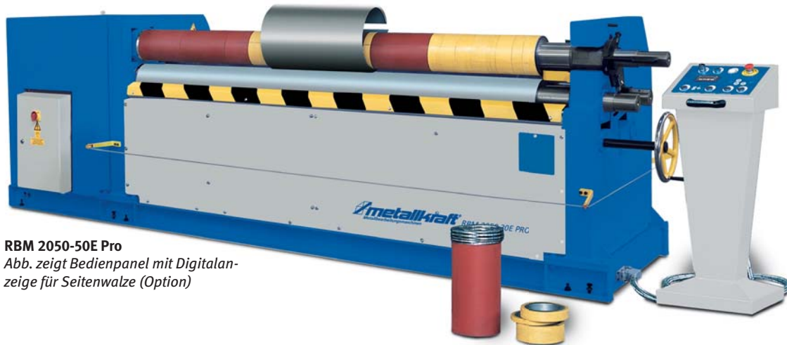
RBM 2050-50E Pro

Abb. zeigt Bedienpanel mit Digitalanzeige für Seitenwalze (Option)