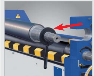
▶ Ausschwenkbare Oberwalze