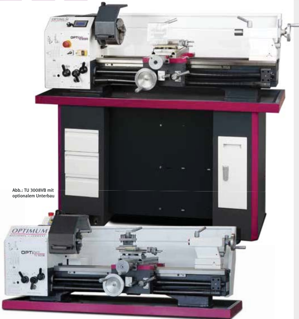
Abb.: TU 3008VB mit optionalem Unterbau