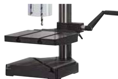
Abb.: TB 10 Basic ▶ Plus mit Sonderausstattung