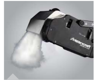
Das Dampfsystem wirkt speziell auf Textilbelägen hocheffizient