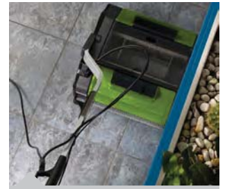
Reinigung bis zur Fußleiste