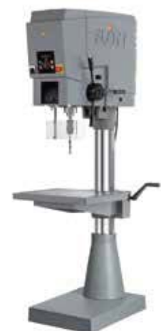
Abb.: SB 30 ▶ Plus mit Sonderausstattung