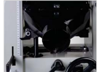
Dickentischverstellung über Handrad, Skala und numerischer Anzeige