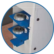
Einschubfächer für Oberwangensegmente

Mit praktischen Ablagen für alle Einzelsegmente und Biegeschienen