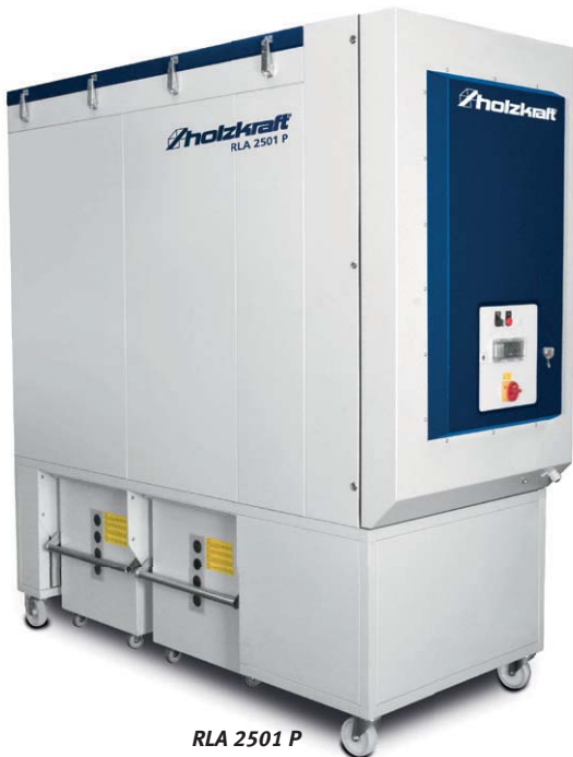
RLA 2501 P

Abreinigung erfolgt durch Druckluftimpulsstöße, die den Filter von innen nach außen abreinigen. Die dadurch hervorgerufene mechanische Verformung der Filter optimiert den Regenerationsgrad bei starker Verschmutzung.