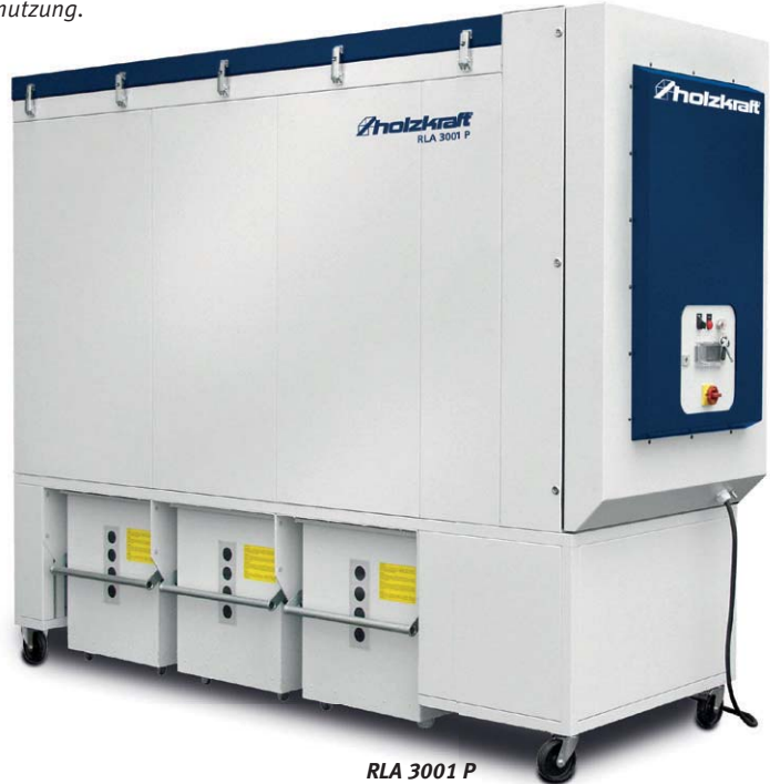
RLA 3001 P