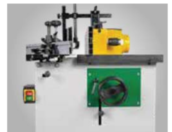
Handrad für Höhenverstellung. Sicherheitsvorrichtungen im Lieferumfang