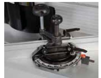
Stufenlos verstellbarer Winkelanschlag