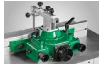
Fräsanschlag mit fein einstellbaren Aluminium-Anschlägen