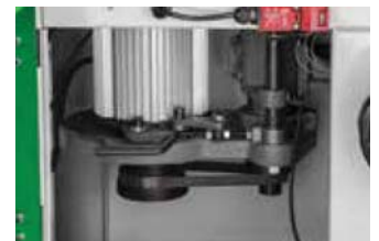
Schnelles und einfaches Wechseln der Drehzahl mittels Vielkeilriemen