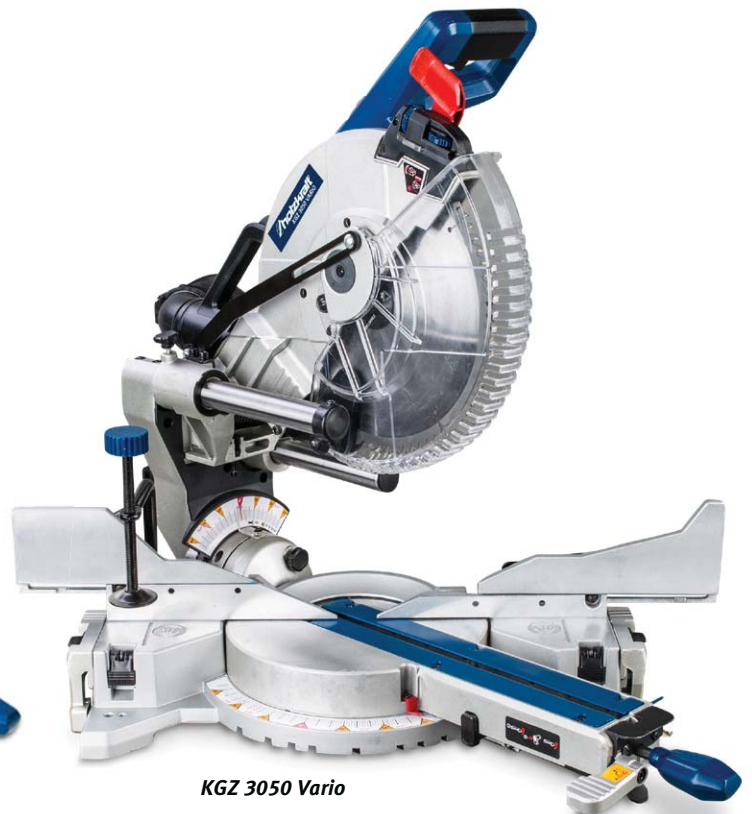
KGZ 3050 Vario