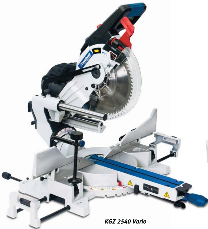
KGZ 2540 Vario