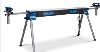
Universal-Werktisch UWT 3200