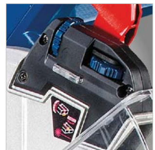
Serienmäßig mit Laser