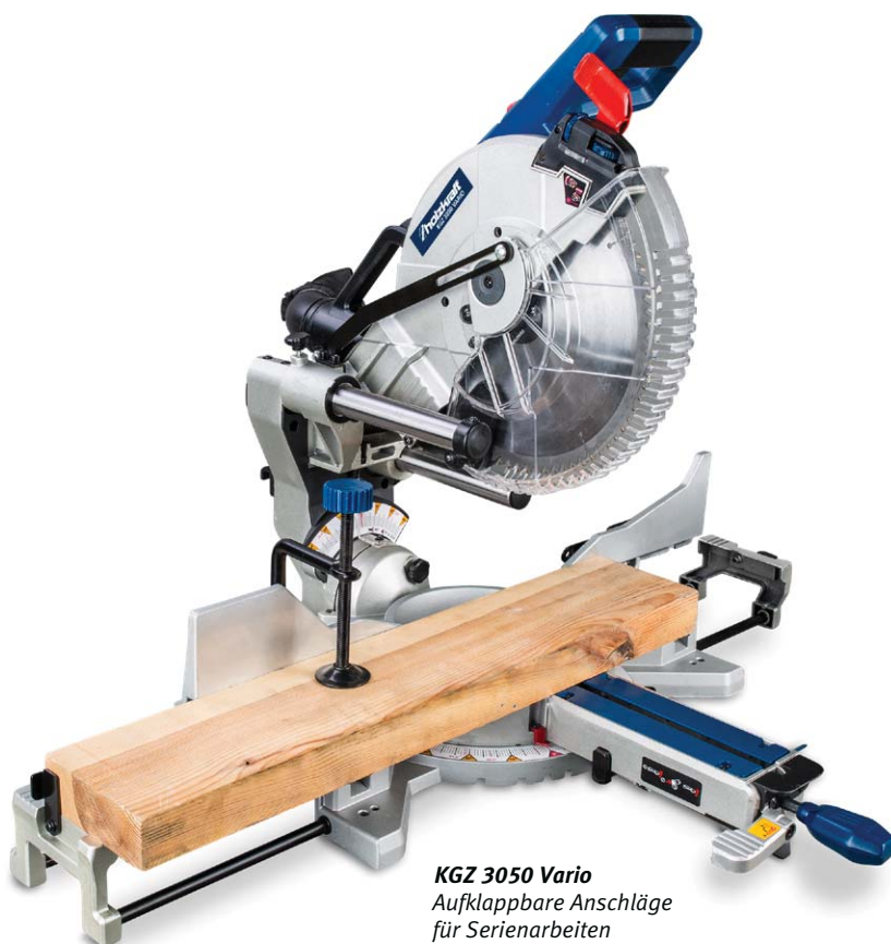
KGZ 3050 Vario Aufklappbare Anschläge für Serienarbeiten