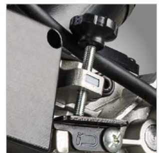
Arretierung zur Kapptiefenbegrenzung