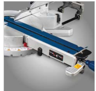
Bequeme Verstellung der Gehrung und der Kopfneigung direkt von der Tischfront aus