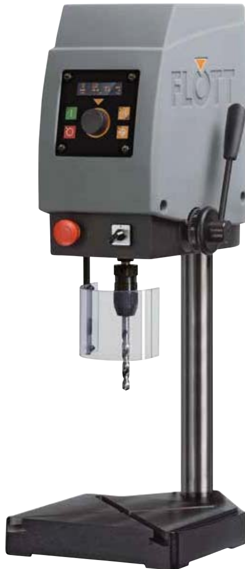
Abb.: TB 10 ▶Plus mit Sonderausstattung