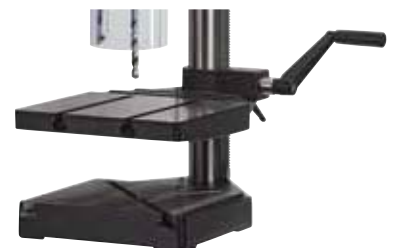
Abb.: TB 10 ▶Plus optional mit Zwischentisch