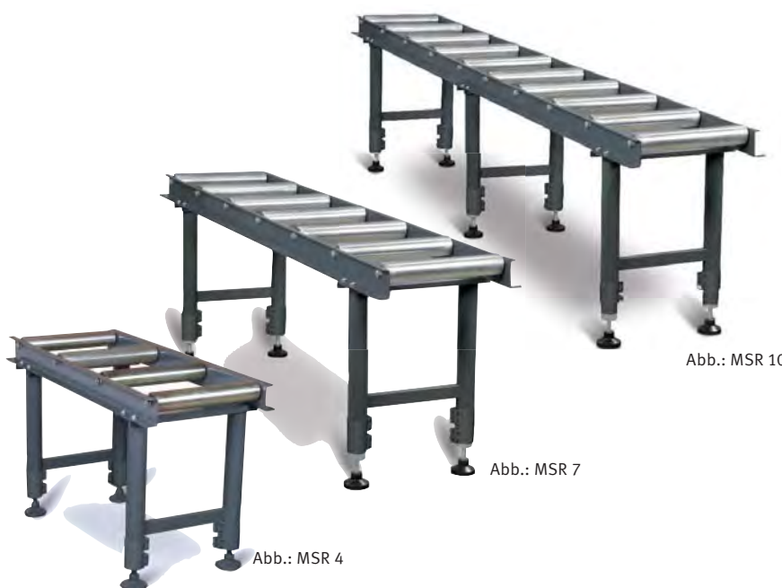
Abb.: MSR 10